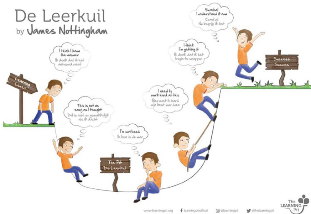
Figuur 2 – Leerkuil van Nottingham, 2007

deze type opgaven ziet? Veel sterke rekenaars kunnen nu enkel antwoorden met; 'Dat weet ik gewoon', 'Zo werkt mijn hoofd' of 'Dat is gewoon zo'. Het is belangrijk dat ze van jongs af aan grip krijgen op hun oplossingsstrategie. Na de check op het lesdoel en de instructie op het plusmateriaal gaan de rekensterke kinderen zelfstandig aan de slag. De vragen die zij tegenkomen verzamelen ze en nemen ze mee naar de instructie voor de volgende dag.